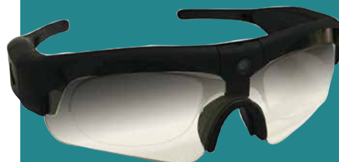
Lenti fotocromatiche di alta qualità

Si tratta di occhiali molto innovativi provvisti di un supporto ottico opzionale per lenti correttive e realizzati con un materiale innovativo che si adatta a ogni viso e a ogni situazione visiva. Dotati di una camera integrata che ruota per scegliere l'inquadratura migliore. Un modello con lente fotocromatica di alta qualità. Il secondo modello con lenti polarizzate, e all'interno della confezione una lente gialla UV e una trasparente. Entrambi i modelli hanno la possibilità di montare lenti correttive. La telecamera integrata è regolabile in grado di realizzare video in formato MP4 in aspetto 16:9. La memoria supportata è una microsd removibile fino a 128 GB come massimo. La batteria ha un'elevata capacità di 3,7 V ai polimeri di Litio, alimentabile dalla rete con una durata di circa 1,5 ore. Sistemi operativi supportati: tutti i principali di Windows, Mac OS e Android System.